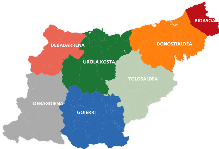
Mapa 2- Comarcas administrativas de Gipuzkoa