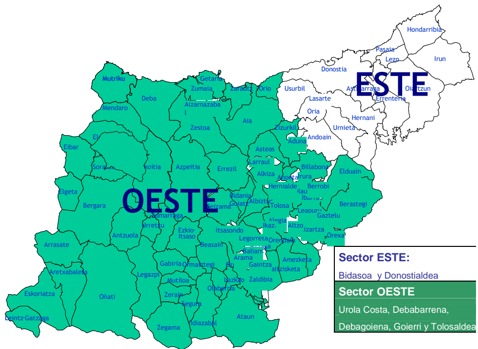
Mapa 1. Sectores de Servicios Sociales de Gipuzkoa