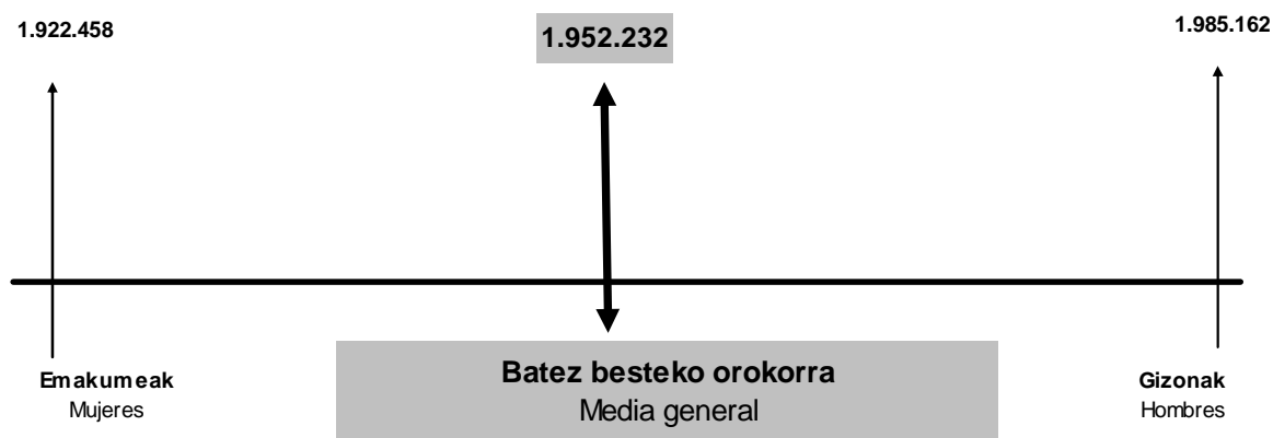
GRÁFICO 2.8. GRAFIKOA Batez besteko oinarri ezargarria sexuaren arabera Base imponible media según sexo

La cuota líquida media de los hombres ascendió a 9.974 euros y es superior en un 7,5% a la de las mujeres (9.276 euros).