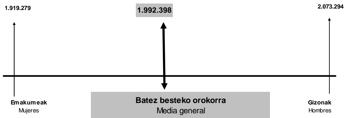
GRÁFICO 2.9. GRAFIKOA