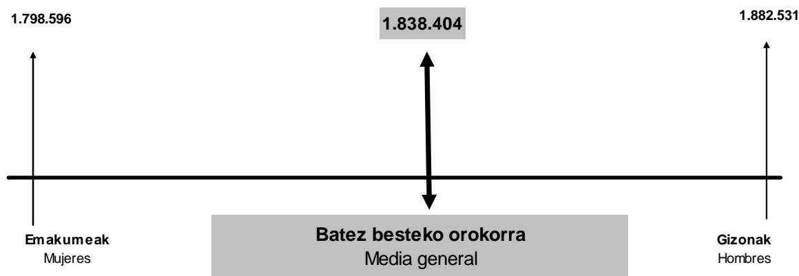
GRÁFICO 2.8. GRAFIKOA Batez besteko oinarri ezargarria sexuaren arabera Base imponible media según sexo

La cuota líquida media de los hombres ascendió a 9.058 euros y es superior en un 12,2% a la de las mujeres (8.075 euros).