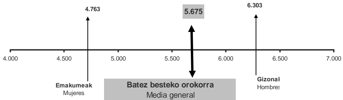
GRÁFICO 1.31. GRAFIKOA Batez besteko kuota likidoa sexuaren arabera (eurotan) Cuota líquida media según sexo (en euros)

La cuota líquida media de los hombres ascendió a 6.303 euros, y es superior en un 32,3% a la de las mujeres (4.763 euros).