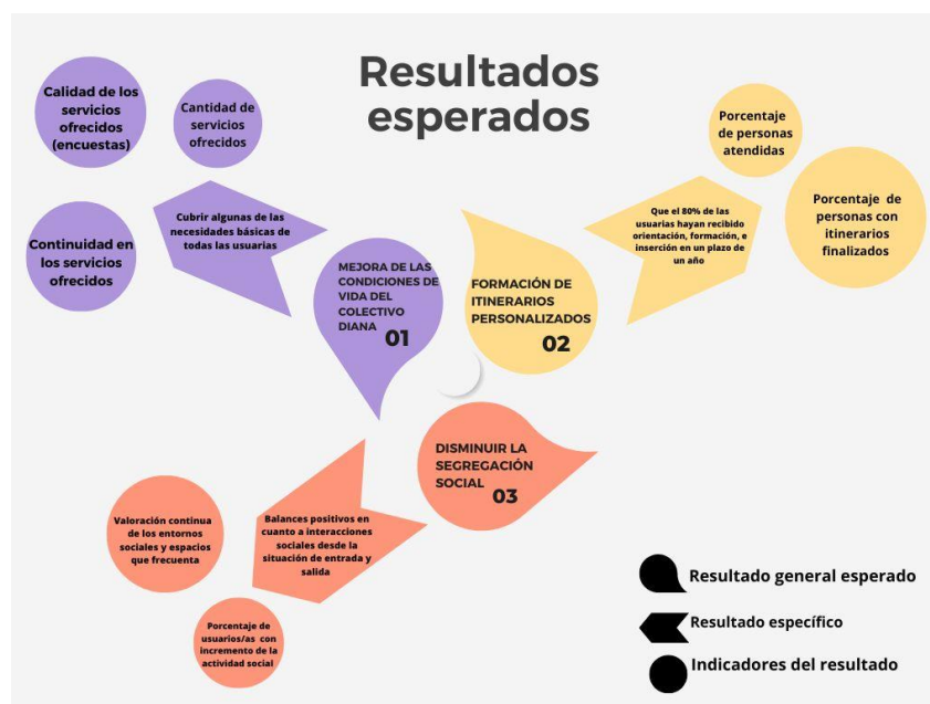
Tabla 4 “Resultados esperados”.

En cuanto a los resultados que se esperan obtener con el proyecto prevemos 3 tipos de resultados, los cuales se reflejan en las dos siguientes tablas-gráficas. Por un lado, los resultados esperados en cuanto a la incidencia del proyecto en los y las usuarias (Tabla 4), hipótesis de resultados e incidencia indirectos (Tabla 5) y, por otro lado, los resultados que se esperan obtener de cara al exterior (Tabla 6). Para el seguimiento y la implantación del proyecto se hará uso de diferentes métodos como encuestas, indicadores de resultados y la observación directa.