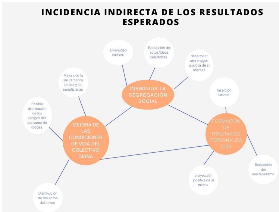
Tabla 5 “Incidencia indirecta de los resultados esperados”.

Siguiendo con los resultados esperados de cara al exterior, el resultado general que se espera obtener es incentivar la sensibilización contra la discriminación xenófoba en la población vasca. Este resultado se medirá en base a indicadores de incidencia, tales como el alcance de las actividades de sensibilización y el trabajo conjunto con agentes exteriores que trabajen contra la discriminación hacia el colectivo inmigrante.