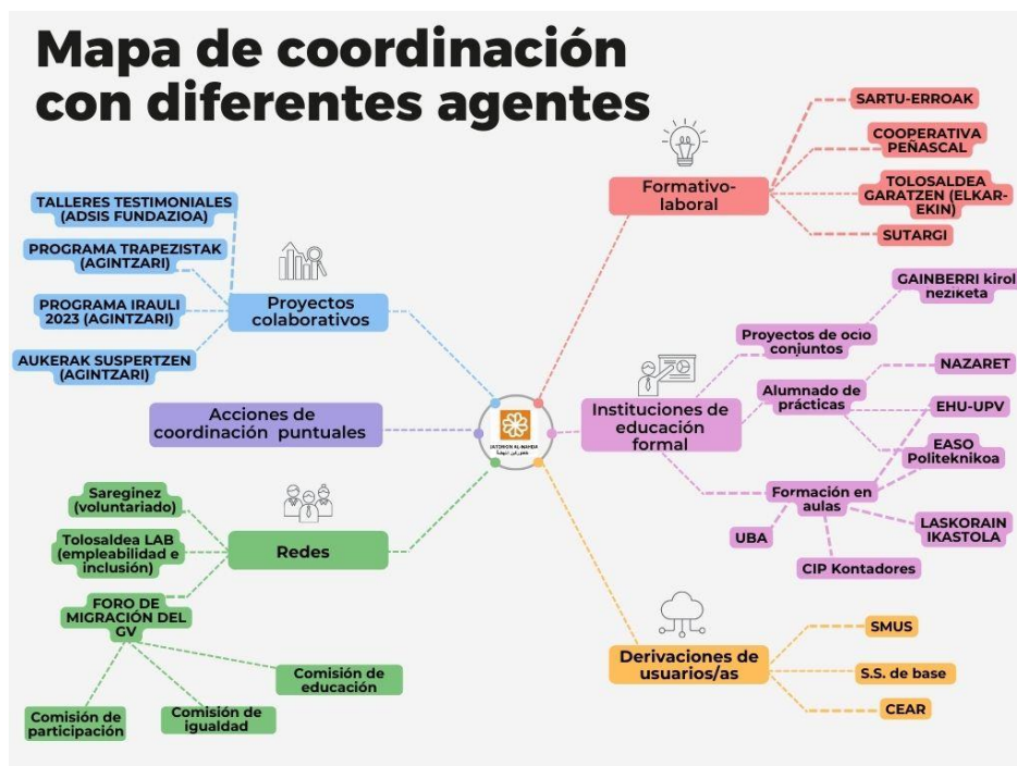
Tabla 6 “Mapa de coordinación con diferentes agentes”.

Por último, este año también hemos tomado parte en el reencuentro que se hace cada 2 años de las personas sin hogar que duermen en la calle “Kale Gorrian”. Hemos tomado parte en el estudio junto con las entidades sociales (Caritas, SIIS “Centro de Documentación sobre servicios sociales y política social). Además, formamos parte de la de Sargi (Asociación para la Coordinación de Entidades Sociales de Gipuzkoa), que tiene como objeto la Promoción de la mejora de la calidad de vida de los colectivos a quienes las Entidades de la Asociación dirigen su actividad, apoyando e impulsando las iniciativas de éstas, a saber: personas con problemas de salud mental, drogodependencias, inmigración, jóvenes en desprotección, exclusión o riesgo de exclusión social, discapacidad, personas privadas de libertad, prostitución, personas seropositivas, mujeres y violencia de género, etc.