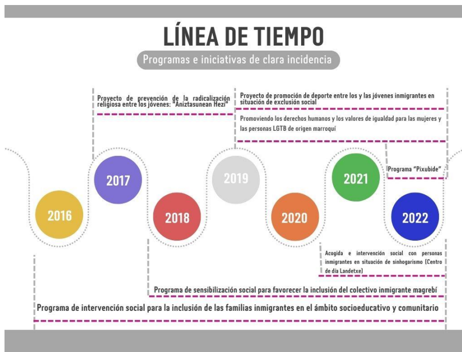
Tabla 1 "Línea de tiempo de programas e iniciativas de clara incidencia". Elaboración propia (2022).