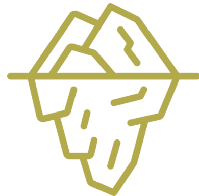
Figura. En la parte superior del iceberg aparecerían las narrativas patentes, pero a medida que se va profundizando se intenta llegar a las metanarrativas (es decir, las percepciones que se revelan bajo las narrativas visibles y que determinan la conducta).

En cuanto a la forma de actuar e investigar, se ha intentado desvelar estas narrativas gradualmente, transitando el camino de superficial a profundo de manera no lineal. En esta forma de trabajar, el proceso cobra una importancia fundamental. Se ha empezado poco a poco, analizando la información extraída y explorando hasta llegar al mapa de percepciones existentes.