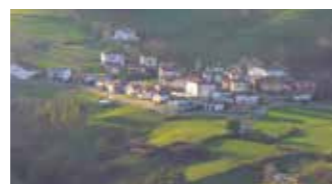
HERRI TXIKIAK 7. Orr.