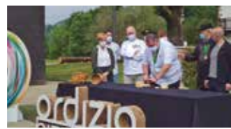
ALBISTE LABURRAK 28. Orr.