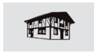
NIRE ETXETXOTIK 23. Orr.