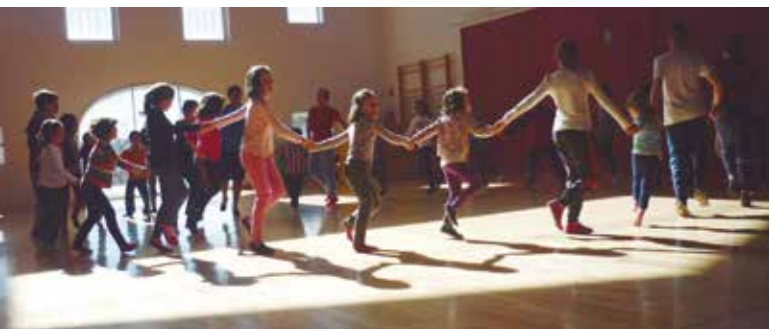
ALTZAGA IKASTOLAKO KIROLDEGIAN. "GURE OHITURAK" DANTZA TALDEA.

Lan-tresna hauek osatu eta definitu orduko eskuragarri izango dira udalari txiki guztientzat, beti ere, udalek herritarrei eskaintzen dien zerbitzua zein bertako langileen lan-egoera hobetzeko helburuarekin.