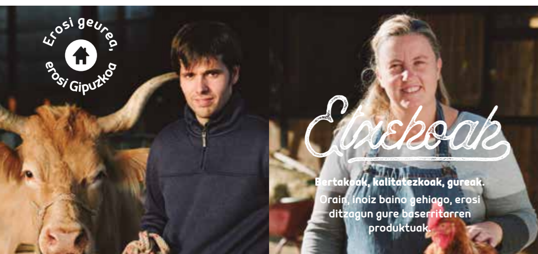
Adur Gorostidi Zubeldi Erdi baserria, Abaltzisketa