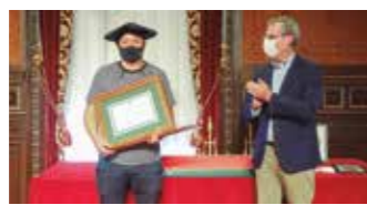
XX. GIPUZKOAKO SAGARDO LEHIAKETA 6. Orr.