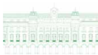
GIPUZKOAKO FORU ALDUNDIKO ATEAK ZABALIK 30. Orr.