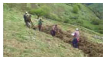
HERNIOKO LANAK 15. Orr.