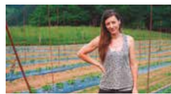
GAZTEAK BASERRIAN 3. Orr.