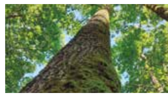
BASOEN KUDEAKETA JASANGARRIA 20. Orr.