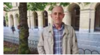
LEHEN SEKTOREAREN ZERBITZURA 24. Orr.