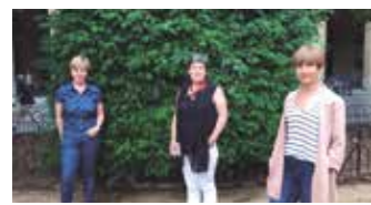
EMAKUMEEK DUTE HITZA 18. Orr.