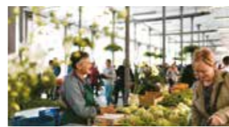
AZOKEN SAREA 12. Orr.