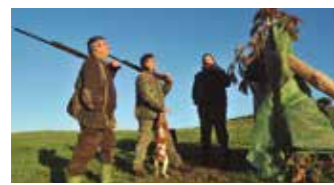
EHIZA 27. Orr.