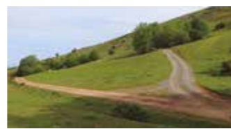
ARALARKO PISTEN AUZIA 16. Orr.