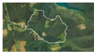
DIGITALIZACIÓN DE LAS PARCELAS RURALES 14. Orr.