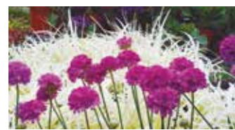
ITURRARANGO LANDARE AZOKA BIRTUALA 13. Orr.