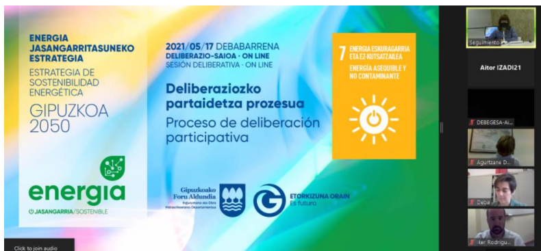
Irudia: Debabarrena eskualdeko saioa.

Estrategiaren jarduerarildoetako ekintzen zerrendatik udalerrien eta eskualdeen ikuspuntutik zeresana izan dezaketen ekintza-sorta eztabaidatu zen partaideekin. Horrela, 32 ekarpen jaso ziren orotara.