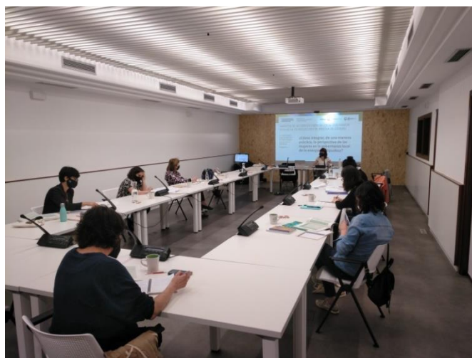
Irudia: Estrategia eta generoari buruzko Saioa (2021-06-09)

Parte hartu zuten emakumeek 28 ekarpen egin zituzten.