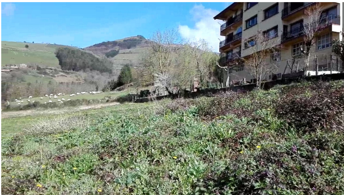
Vista de la parcela bajo estudio

Es objeto de este informe recoger las conclusiones de dicho estudio acústico de ruido realizadas así como la identificación de fuentes de ruido realizada in situ con fecha 13 de marzo de 2018.