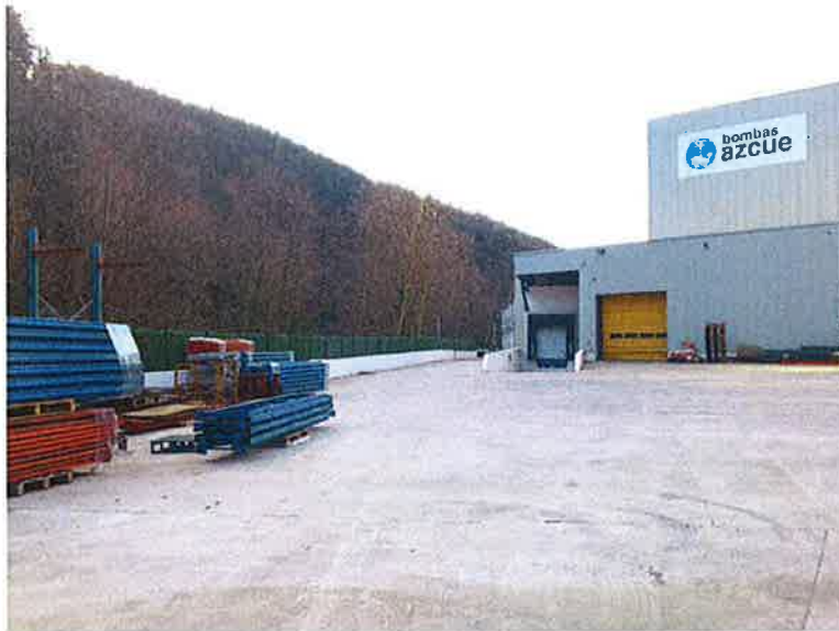
Límite de la parcela con el río Narrondo, vista tomada en dirección aguas arriba. El encauzamiento y cerramiento recorre la totalidad de la margen fluvial lindante con las instalaciones.

Los suelos que se verán afectados por las actuaciones previstas carecen de vegetación. El talud limítrofe con el trazado del ferrocarril esta ocupado por una formación heterogénea de vegetación de porte predominantemente arbustivo y de interés botánico muy reducido.