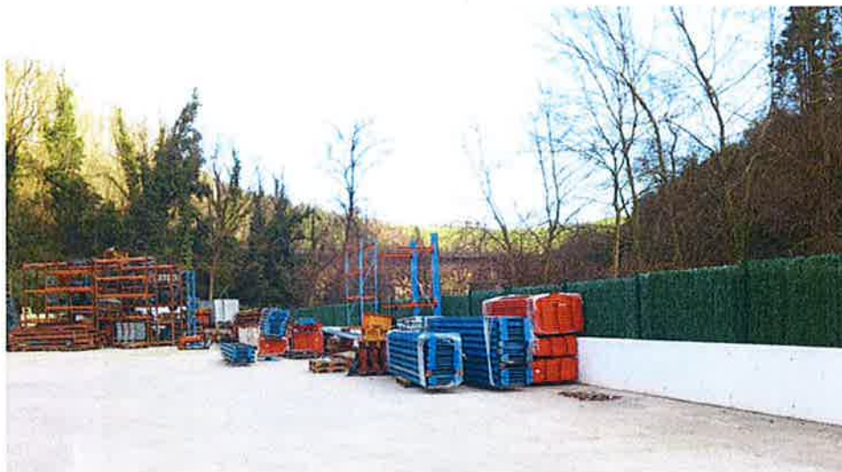
Límite de la parcela con el río Narrondo. Vista tomada en dirección aguas abajo. Encauzamiento y cerramiento.

Euskotren por el oeste. El río Narrondo, a su paso junto a las instalaciones de Bombas Azkue, presenta un encauzamiento consolidado que no se va a ver afectado por las actuaciones previstas. En tramos hay vegetación arbolada en la margen derecha del río que sombrea el cauce, favoreciendo las condiciones ecológicas del río. El río Narrondo en su totalidad esta incluido como "área de interés especial" en el Plan de Gestión del visón europeo (Orden Foral de 12 de mayo de 2004, por la que se aprueba el Plan de Gestión del Visón europeo mustela lutreola (linnaeus, 1761) en el territorio histórico de gipuzkoa. De acuerdo a las indicaciones de la propiedad, la actuación sobre el río se realizaron en su día de acuerdo a los criterios de la UR Agentzia - Agencia Vasca de Agua y con su visto bueno.