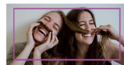
KONTZIENTZIA ETA GORPUTZA