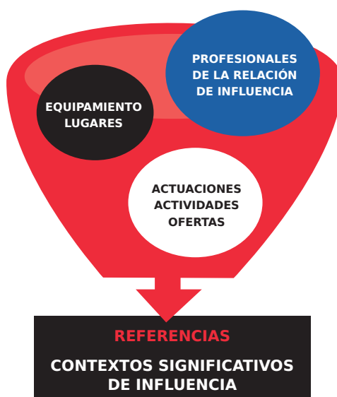
Gráfico 2 COMPONENTES Y RESULTADOS DEL SERVICIO POLIVALENTE PARA ADOLESCENTES