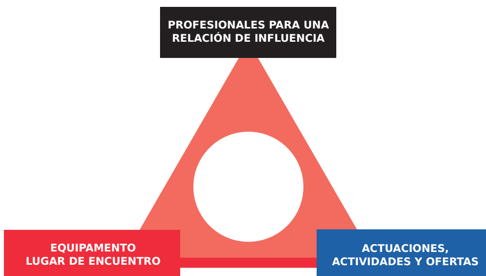
Gráfico 1 LAS TRES DIMENSIONES DEL SPA

El Servicio Polivalente para Adolescentes debe tener siempre componentes de las tres dimensiones, como se indica en el siguiente gráfico: