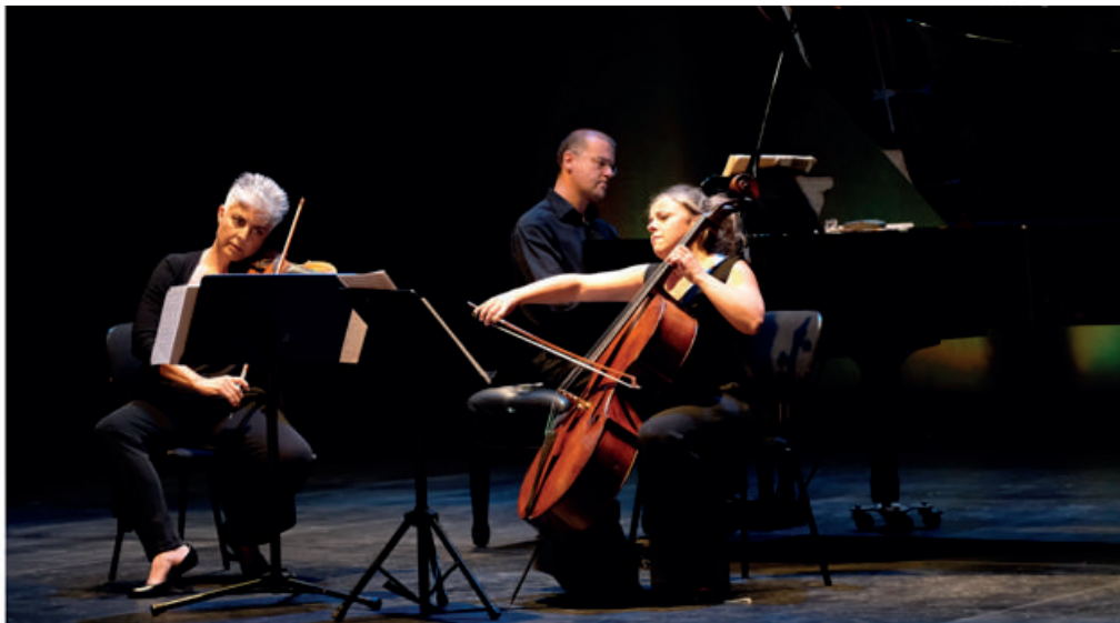
B3: Trío Brouwer

En su línea de acción más reciente ha estrenado la video ópera de cámara La Isla de la compositora Nuria Núñez Hierro. Apuesta por la interacción multidisciplinar (live painting, danza, teatro etc.) y promueve la investigación en el uso de las nuevas tecnologías aplicadas a la música (electrónica, video, sensores, sistemas de iluminación etc.)