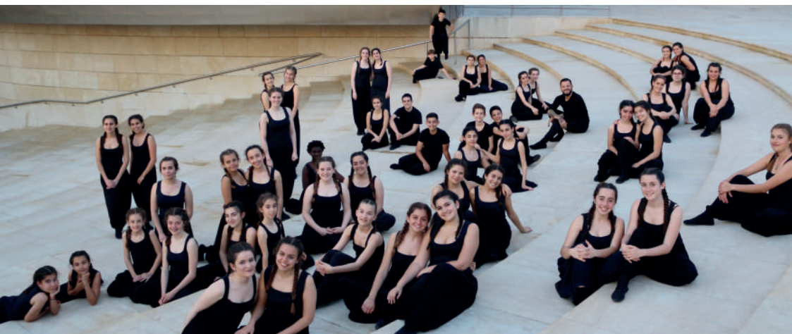
Leioa Kantika Korala

El coro ha ofrecido conciertos recientemente en Tenerife, Barcelona, Bordeaux o Toulouse y próximamente visitará Granada o Basilea entre otros destinos.