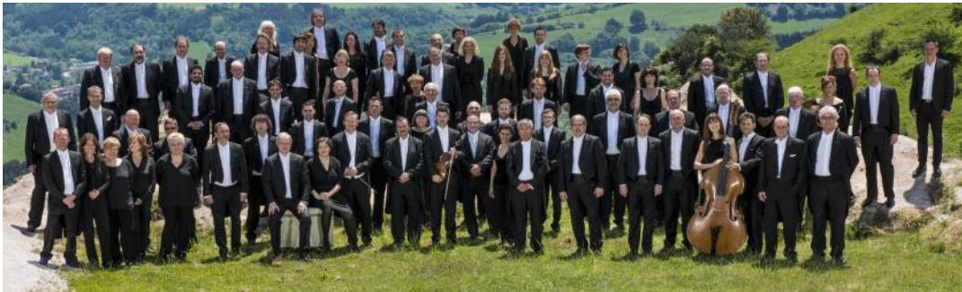
Bilbao Orkestra Sinfonikoa