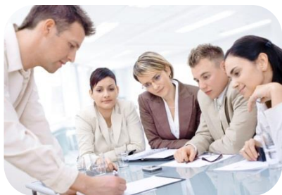
Participación en la Gestión