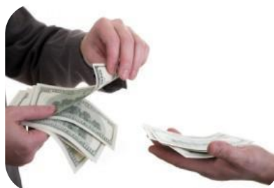
Participación en los Beneficios