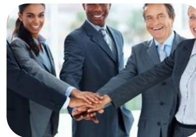
Participación en la Propiedad (PFT)